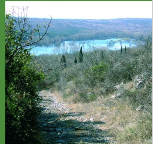
Il lago di Doberdò dalle pendici di q. 208 sud